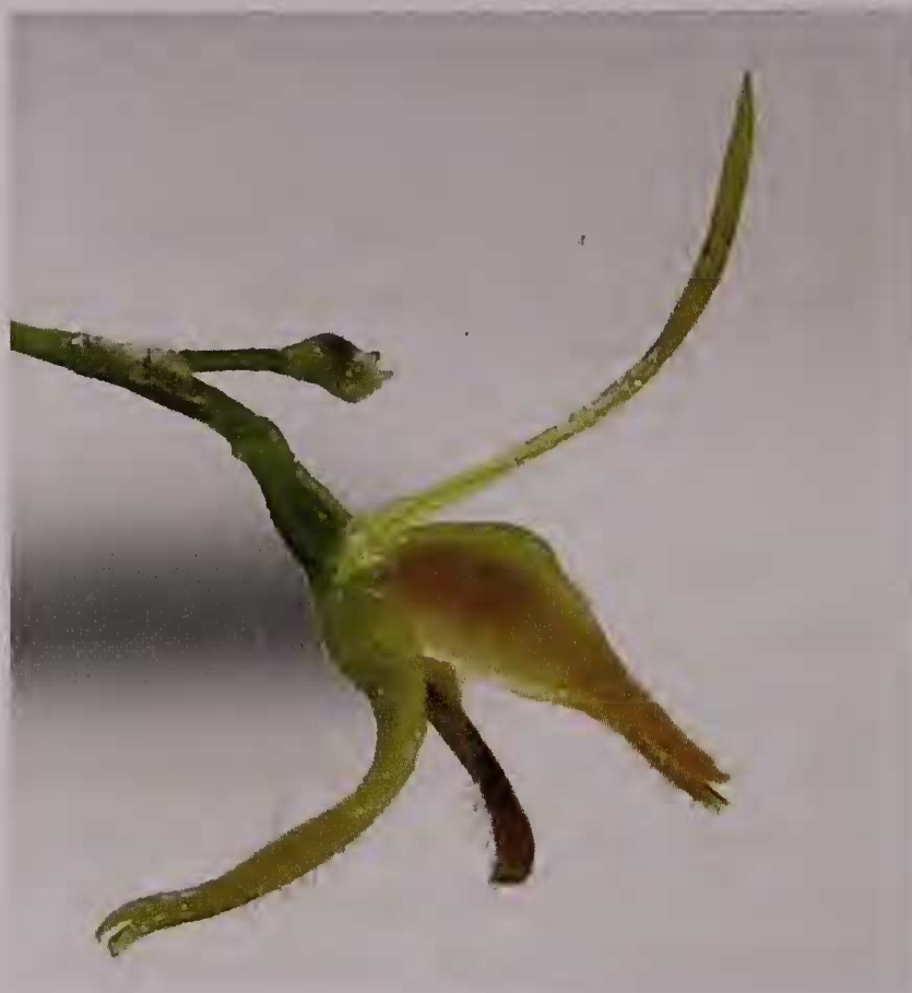
Fig. 2 : fleur de Anathallis edmeiae